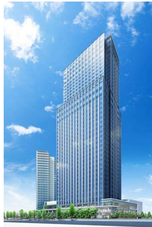
「仙台トラストシティ」完成予想図

仙台市では、JR仙台駅に隣接して建つ超高層ビル「アエル」に、分速300mの高速機種を含むフジテックのエレベータ17台と、エスカレータ10台が活躍しており、「仙台トラストタワー」が完成すれば、新たな超高層ビルの実績が加わることとなります。