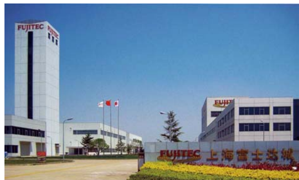
左から「上海RDセンター」「上海調達センター」 「上海華昇フジテック」