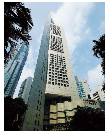
モダニゼーション工事が進む「ワン・ラッフルズ・プレイス」の様子

高い技術力を要する大型・高速エレベータのモダニゼーション工事で技術ノウハウを蓄積し、グローバルにおけるアフターマーケット事業の拡大につなげます。