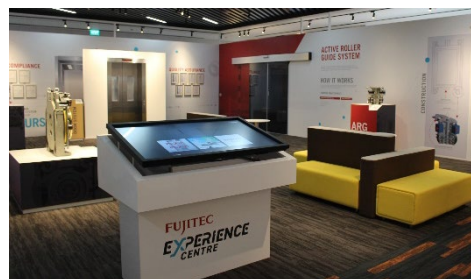
エクスペリエンスセンター シンガポール

近年は人材育成施設「エクスペリエンスセンター」を開設し、南アジア地域のフィールドエンジニアのさらなる育成強化に加え、シンガポール政府と連携し、次世代への技能伝承にも取り組んでいます。また、デジタル技術を活用したサービスの展開にも注力し、次の50年に向けて変革の歩みを進めています。