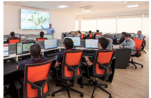
遠隔監視システムを運用するセーフネットセンターの様子

また、改革を加速するため、新たなデジタルツールの習得を目的とした従業員向け再教育のプログラムも実施しています。