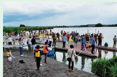
外来魚駆除釣り大会