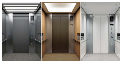
Smart Elegant Friendly

「利用者の生活に自然と溶け込む心地よいエレベータ空間」を追求し、空間を構成する照明、カラー、素材そしてインフォメーションデザインを、最新のインテリアトレンドに合わせて一新しました。