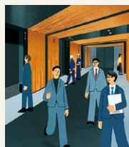
Illustration : Maeda Yuki

「あのジョブを訪ねて」訪問先の風景と、フジテックの従業員が生き生きと働く姿をお届け。今号は、長崎スタジアムシティのオフィス棟の昇降機と、巻頭企画に登場している3名の姿を描きました。