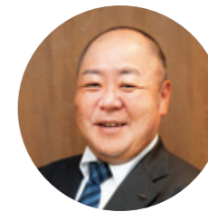
フジテック株式会社 近畿統括本部 神戸支店 サービス営業グループ 課長