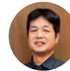
フジテック株式会社 近畿統括本部 神戸支店 但馬サービスセンター 主管

2006年の入社以来、リニューアル営業一筋。西村屋ホテル招月庭様のリニューアルでは、ご要望をヒアリングし、プラン提案から工事の調整など細部まで関わる。