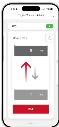
操作画面イメージ

当社は、ブランドビジョン「世界を、もっとフラットに。」の体現に向け、本機能を通じて誰もが自由に、“安全・安心”に移動できる社会の実現に貢献していきます。